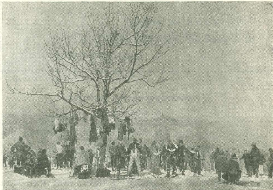
Síparadicsom a budai erdőben

igazodva, avagy ezeket megsértve gazdákodik ezzel a természeti kincssel. A gazdasági fejlődés nyomán a társadalmi jólét rövidebb távlatú javítása érdekében az egész világon tapasztalható, hogy az erdők igénybevétele és kezelése nem felel meg mindig és mindenütt az alapvető biológiai követelményeknek. Ennek következtében gyakrabban lépnek fel a károsítók, amelyekről éppen azóta vannak részletesebb ismereteink, amióta a világ erdeiben rendszeres erdőgazdálkodás folyik.