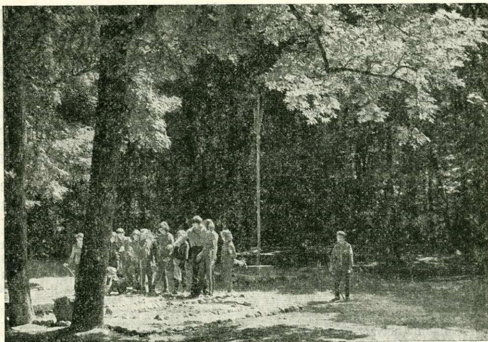
A természet szeretetére nevel az erdei tábor (Jérôme R. felvételei)

A felsoroltak elhagyása vagy nem teljesítése miatt gyakori a fák és facsoportok, vagy nagyobb erdőállományok pusztulása. Ennek a felelőssége minket illet, az új esztendőben nem mentünk vagy menthetünk fel ez alól egyetlen erdészt sem. Ez mindenekelőtt a mi dolgunk és feladatunk.