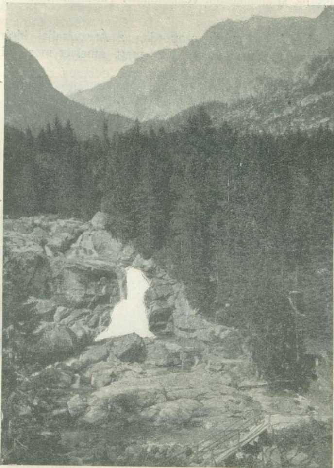
A tarpataki vizesés.

Alighogy elértünk Tátrafüredre, megindult az eddig örömmel nélkülözött zápor, de amint jött, éppen oly gyorsan távozott, úgy hogy Tarajkára már ismét szép időben vonultunk fel. Innen