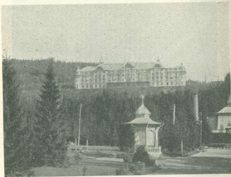
A tátralomniczi palota-szálló.

A kirándulók másik csoportja, az Árvaváraljai kirándulás kihagyásával, ugyanazt az utat tette meg, amelyet most leirtunk,