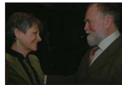
Erdészbál Visegrádon .....64

ERDÉSZETI LAPOK • Az Országos Erdészeti Egyesület folyóirata CXLIV. évfolyam 2. szám (február)