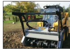
Szabó József–Horváth Béla: Nagygépek az erdészeti technológiákban.....49