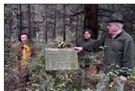
Pápai Gábor: Pilisi trilógia: Budapest Árpád-kilátó, Mogyoróhegy, Budakeszi Arborétum.....378