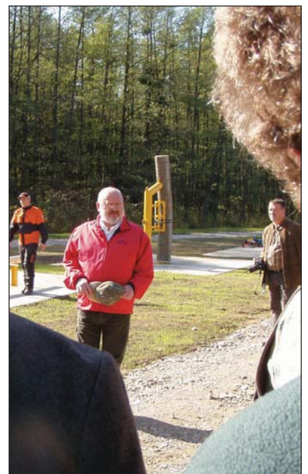
Az erdészeti ágazat munkabalesetei 2002-2006-ig

Az oktató és gyakorló bázis a Ropoly alatti völgyben helyezkedik el. Ropoly vára a honfoglalás utáni időktől kezdve őrizte a Zselic mocsaras völgytalpai és erdős, meredek oldalú dombjai által képzett gyeptér legkönnyebben járható szakaszát. Ez a vár kőfalak nélküli cölöpvár lehetett földszáncokkal, ezért mára szinte teljesen elenyésztek a maradványok. Annál is inkább, mert a 14. században már Ropoly szerepét átvette Ropolyújvár (Kaposújvár) erődít-