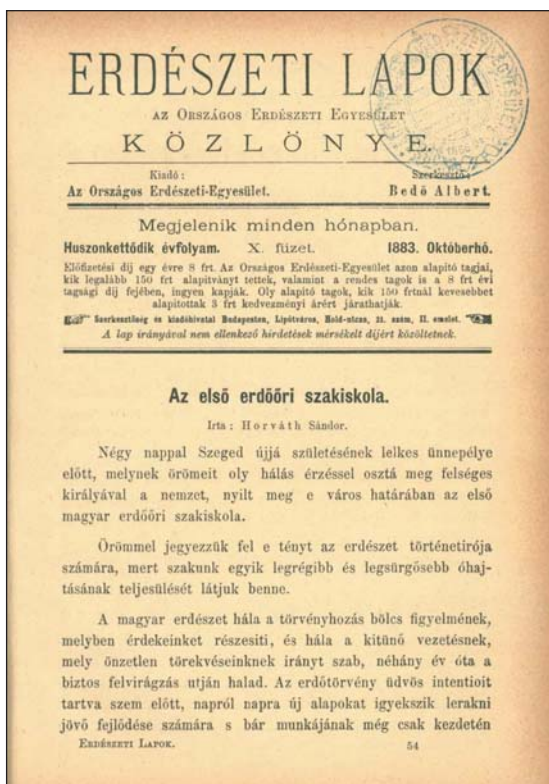
1883 októberi címlap