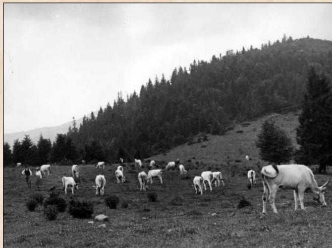
Legeltetés a Gyergyói-medence területén.