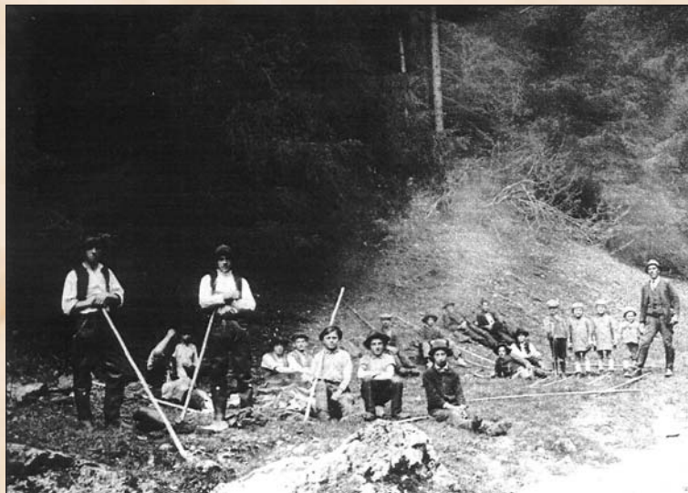
Erdői munkások a besztercebányai erdőigazgatóság területén.

Sem az arányosítás nyomán előállt konfliktusok, sem a közbirtokosságok törvény által előírt szervezése nem ért nyugvópontra az első világháború kitöréséig.