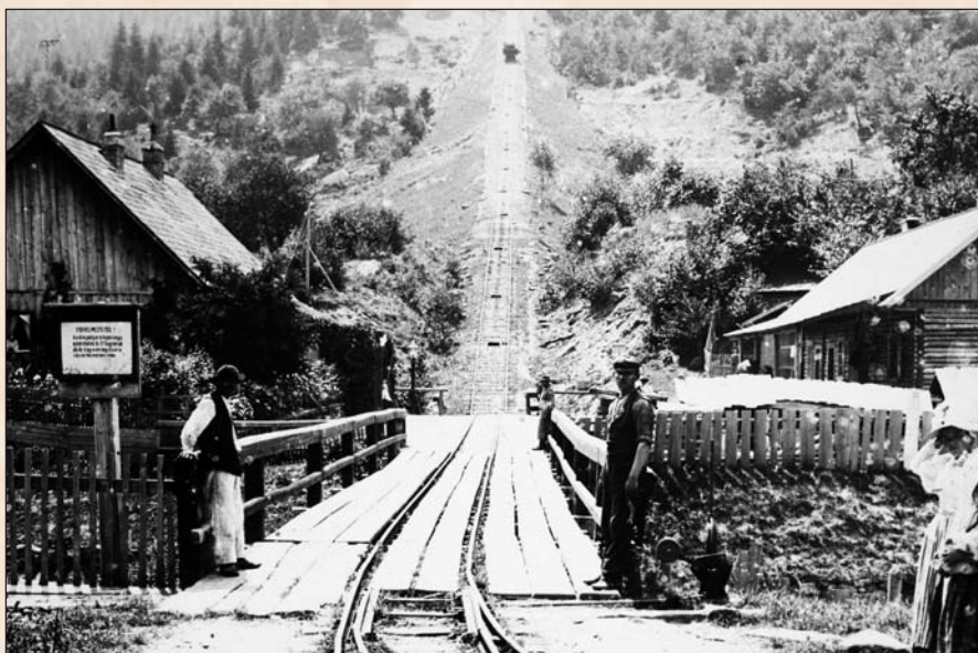
A kommandói sikló 1914-ben.

be költségvetési tervezetet, az erdőigazgatóság hitel hiányában nem engedélyezte. 2