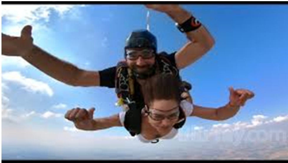
7. ábra Jodorowsky, A. Psychomagic, A Healing Art . [Film]. Paris: Satori Films. 2019. Operatőr: Pascale Montandon-Jodorowsky.

3. Eset: Egy negyvenhét éves férfi, aki nem akar többé dadogni (Jodorowsky, A. Psychomagic, A Healing Art . [Film]. Paris: Satori Films. 2019).