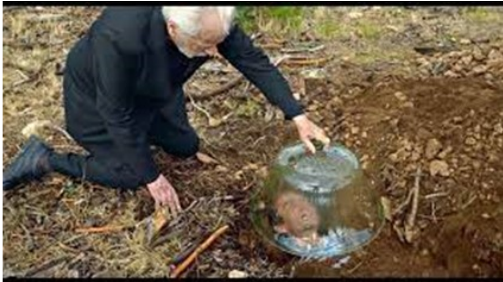
2. ábra Jodorowsky, A. Psychomagic, A Healing Art . [Film]. Paris: Satori Films. 2019. Operatőr: Pascale Montandon-Jodorowsky.