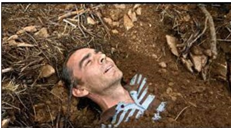
1. ábra Jodorowsky, A. Psychomagic, A Healing Art. [Film]. Paris: Satori Films. 2019. Operatőr: Pascale Montandon-Jodorowsky.

kamerán át szemtanúja annak, hogyan zabálják fel, marcangolják szét a rajta elhelyezett húsdarabokat a dögevő madarak. Kis idő elteltével Jodorowsky elzavarja őket és kiségti a férfit a gödörből. Meztelen testére több üveg fehér tejszerű folyadékot önt, majd miután páciense tisztára törölközött és segítségével új ruhába öltözött, a mellkasára teszi – egy piros lufi madzagjának végére kötözve – édesapjának a fényképét és a következőket mondja: „Itt van az apád. Fogd és szabadulj meg tőle.” A férfi elveszi a fényképet és azt a piros lufival együtt az ég felé ereszti. Két hónappal később egy interjú során a volt páciens úgy nyilatkozik, hogy az eltelt idő alatt több felismerésre is jutott, mint például, hogy a párizsi életmód nem neki való, de mosolyogva számol be arról is, hogy már sokkal kevesebb öngyilkosságra készítő gondolata van.