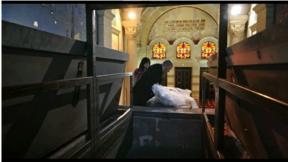
6. ábra Jodorowsky, A. Psychomagic, A Healing Art . [Film]. Paris: Satori Films. 2019. Operatőr: Pascale Montandon-Jodorowsky.