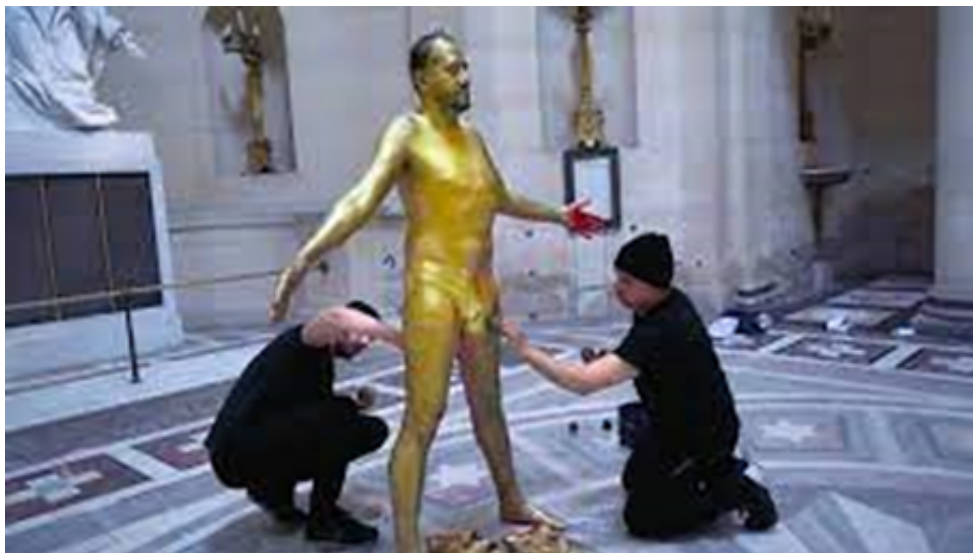
10. ábra Jodorowsky, A. Psychomagic, A Healing Art. [Film]. Paris: Satori Films. 2019. Operatőr: Pascale Montandon-Jodorowsky.