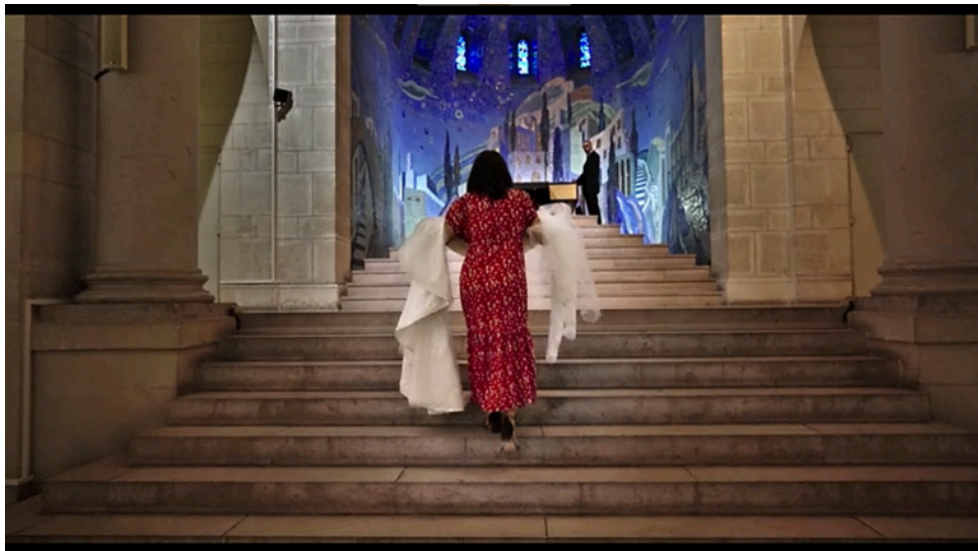
5. ábra Jodorowsky, A. Psychomagic, A Healing Art. [Film]. Paris: Satori Films. 2019. Operatőr: Pascale Montandon-Jodorowsky.