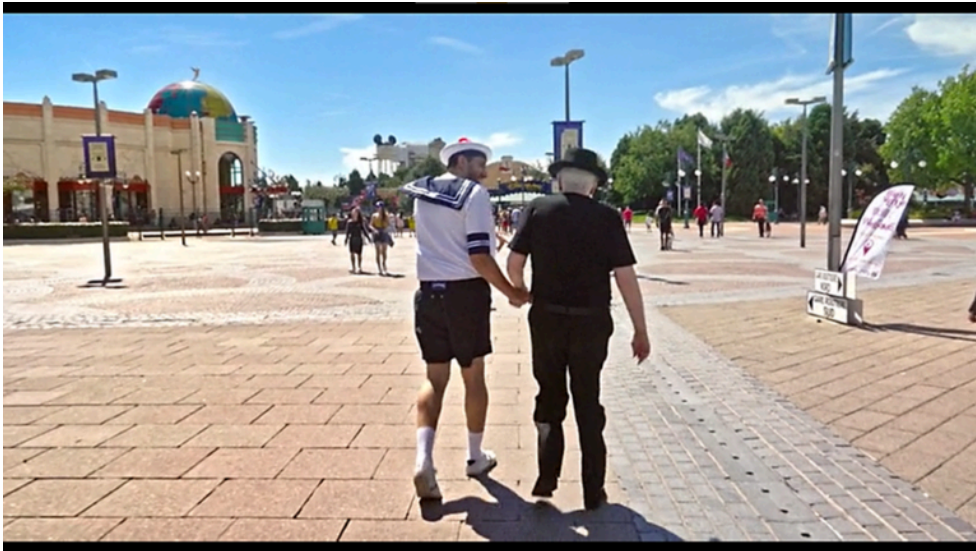
8. ábra Jodorowsky, A. Psychomagic, A Healing Art. [Film]. Paris: Satori Films. 2019. Operatőr: Pascale Montandon- Jodorowsky.