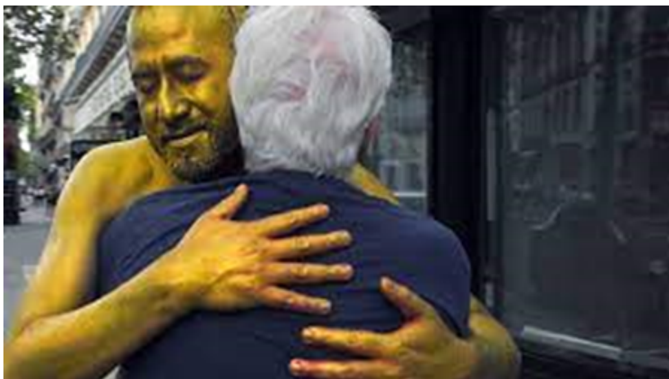
11. ábra Jodorowsky, A. Psychomagic, A Healing Art. [Film]. Paris: Satori Films. 2019.