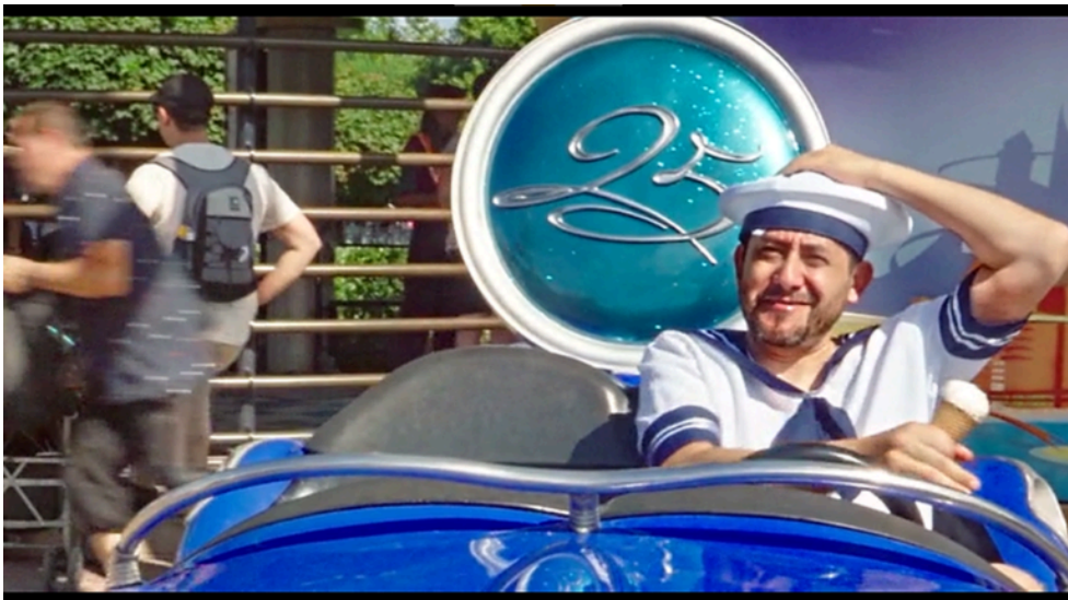
9. ábra Jodorowsky, A. Psychomagic, A Healing Art. [Film]. Paris: Satori Films. 2019. Operatőr: Pascale Montandon- Jodorowsky.