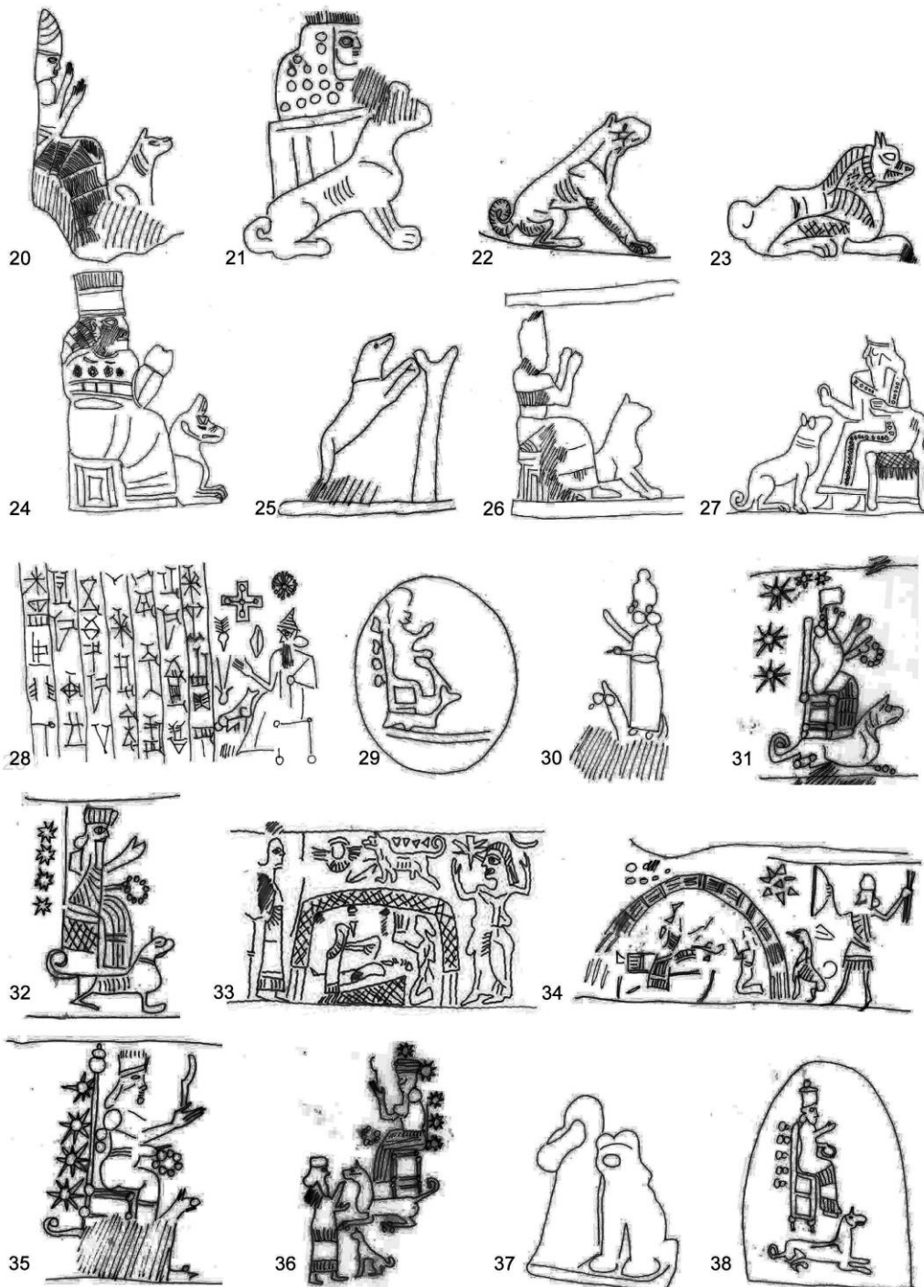
6. ábra rajzok