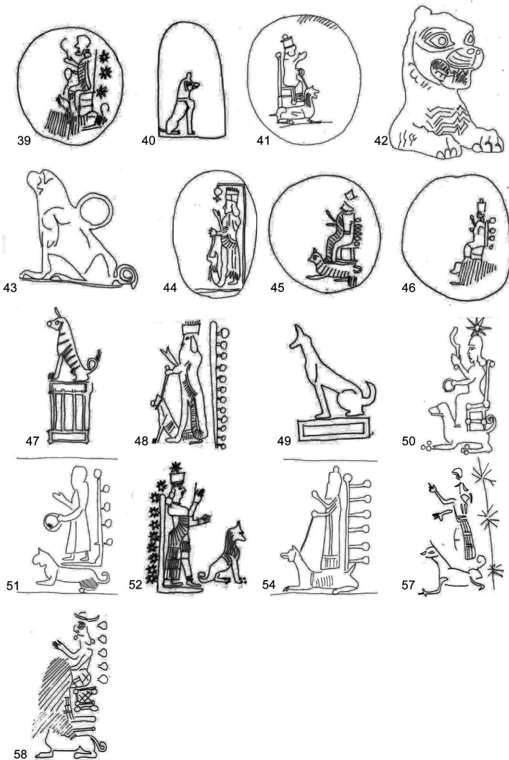
7. ábra rajzok