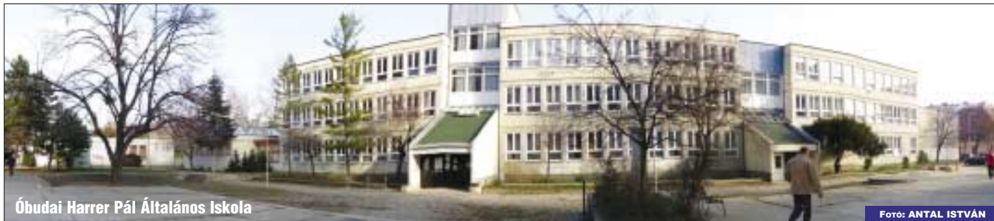
Óbudai Harrer Pál Általános Iskola