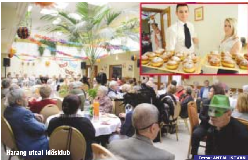
Harang utcai idősklub

(Cím: Füst Milán utca 26. Telefonszám: 245-3409; e-mail: fszek0305@fszek.hu ) sz