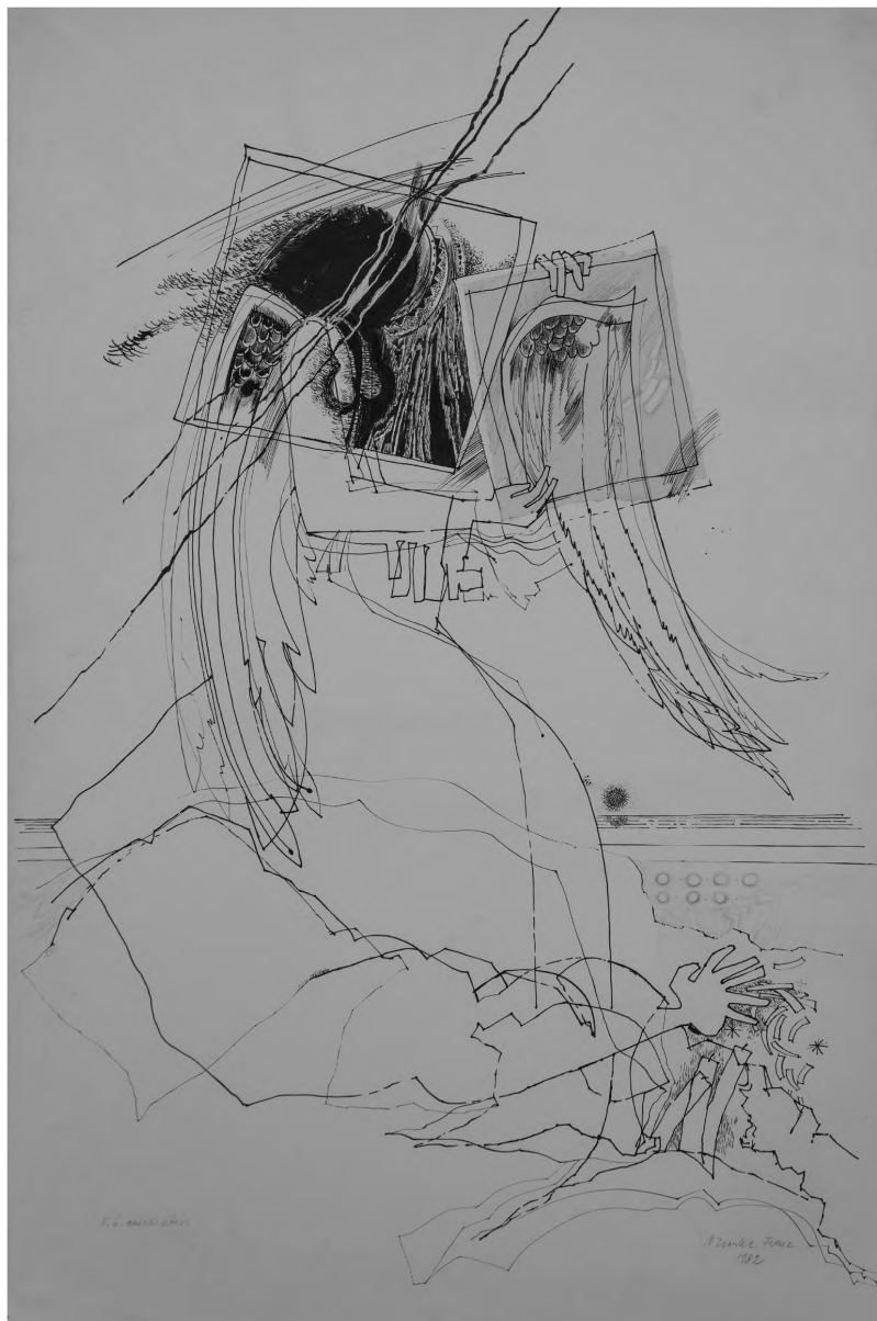
Paróczai Gergely emlékezetére (A Dornyay Béla Múzeum tulajdona, ltsz. 89. 2.)