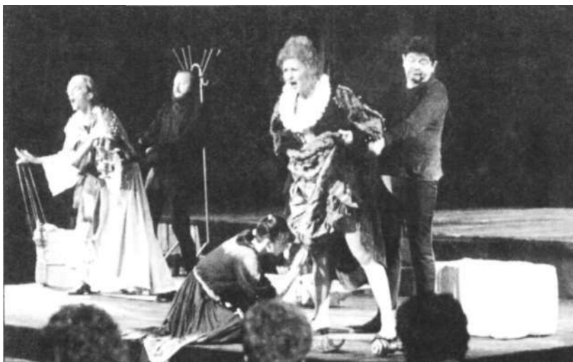
Részlet Foster: I. Erzsébet című darabjából

ezért ez a darab kitűnően illeszkedik az egervári várkastélyhoz. [Az egervári vár majd 140 évig volt a Nádasyak birtoka: 1535-től 1671-ig. Aszerk. |