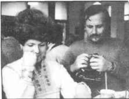
Magyar Műhely találkozózn 1974-ben