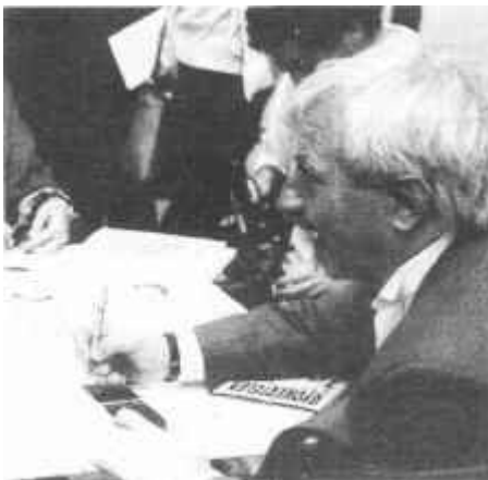
Az 1984-es könyvhéten dediká