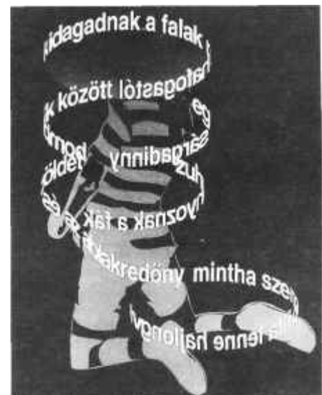
A Vendégszövegek 4 című kötetből