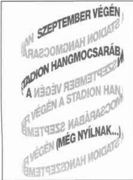
A Vendégszövegek 4 című kötetből