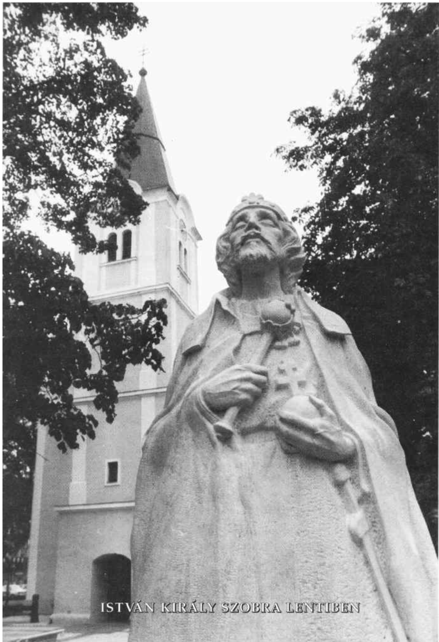
ISTVÁN KIRÁLY SZOBRA LENTIBEN