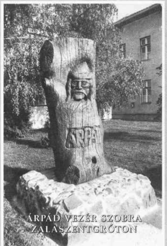
ÁRPÁD VEZÉR SZOBRA ZALASZENTGRÓTON