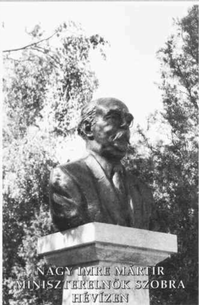
NAGY IMRE MÁRTIR MINISZTERELNÖK SZOBRA HÉVÍZEN