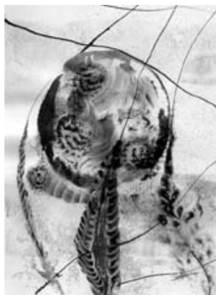
Czirok Ferenc illusztrációi a kötethez