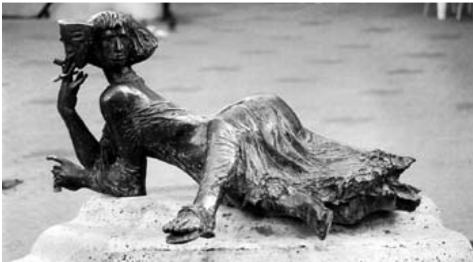
Színház téri díszkút, Pécs