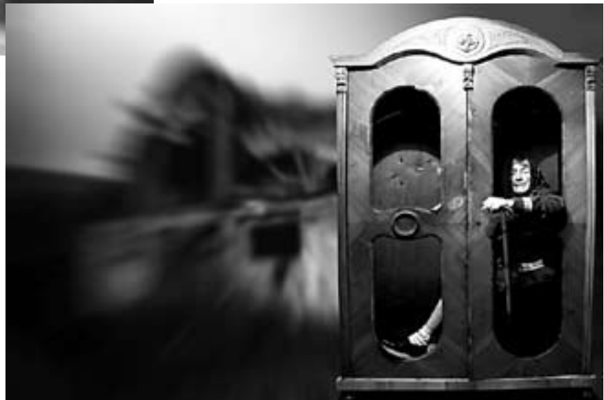
Incze István: Régiség