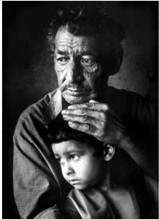
Haragos Zoltán: Portré