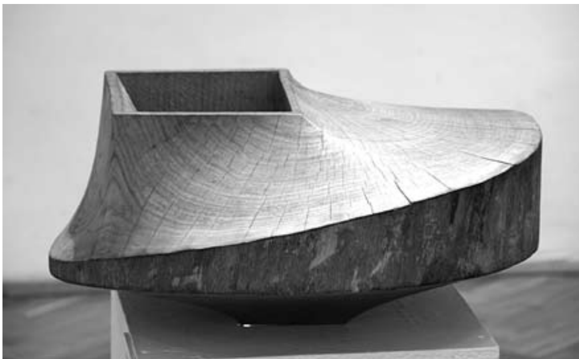
Gombos Andrea: Cím nélkül II. tölgyfa 60x25 cm