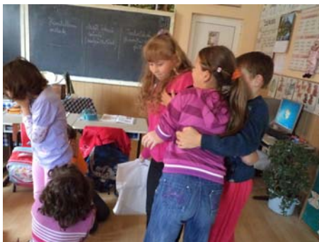
A nagynéni közbelép