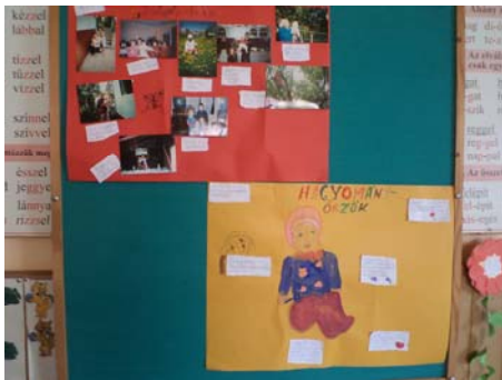
Gyerekképek, családi fotók és a hozzájuk társított kitalált, kedves szöveg