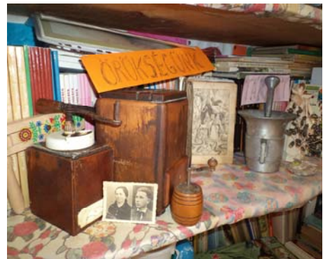
A „régészek” munkája