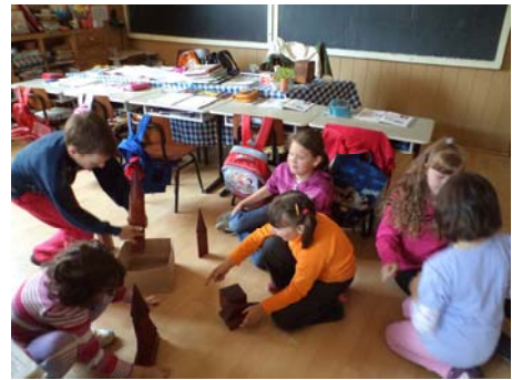
Szent a béke!