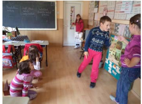
Forrósodik a helyzet!