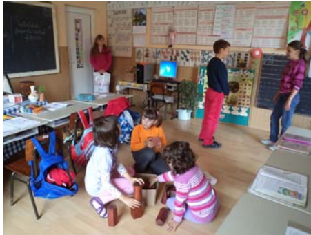
Csupa fül gyermekek