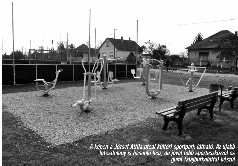
A képen a József Attila utcai kültéri sportpark látható. Az újabb létesítmény is hasonló lesz, de jóval több sporteszközzel és gumi talajburkolattal készül

A pályázat kiírása kapcsán el kell mondani, kormányzati cél a mindennapi testmozgás, az egészséges életmódra való nevelés támogatása, mivel a magyar lakosság - beleértve a sarkadiakat is - mozgásszegény életmódot folytat, ami nagyban kihat az egészségi állapotra. Számos kutatás kimutatta, hogy a felnőtt magyar lakosság alig 10 - 15%-a mozog rendszeresen és ez a szám hasonlóan rossz a gyermekek esetében is, mivel az iskolai testnevelési órákat leszámítva a magyar gyermekek alig 10%-a sportol rendszeresen, az iskolán kívül. Mivel az egészségmegőrzés legfontosabb eszközei közé tartozik a test-