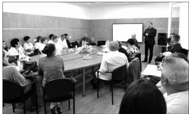
Dr. Mokán István polgármester megnyitója

A 39./2016. (XII. 21.) EMMI rendelet értelmében döntés született az Elektronikus Egészségügyi Szolgáltatási Tér (EESZT) kialakításáról, valamint a minden egészségügyi szolgáltatóra nézve kötelező csatlakozásról. Ennek kapcsán a Kistérségi Járóbeteg Szakellátó Centrumban 2017. május 11-én megrendezésre került a tér kialakításáról, működéséről szóló tájékoztató a térség minden szakorvosra, háziorvosra, fogorvosra, egészségügyi szakdolgozóira, védőnőire, gyógyszerésze meghívásával.