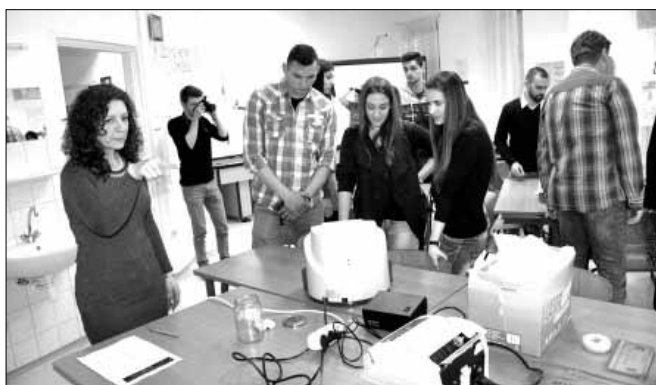
neve: Informatikai rendszer-üzemeltető).

Ezen a napon az intézmény tárt karokkal várta az érdeklődőket, hiszen az este célja az volt, hogy bemutatassuk az iskolában oktatott két szakmát, a postai üzleti ügyintézőt és az informatikai rendszergazdát (a szakma új