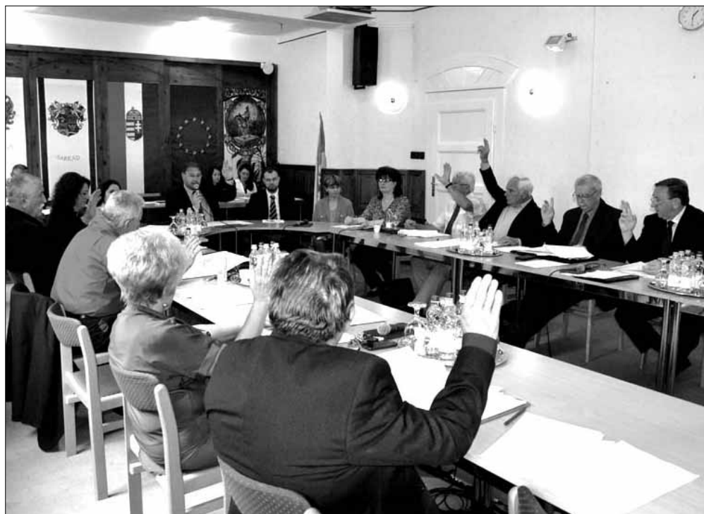
Az önkormányzat keretében végzett gyermekjóléti és gyermekvédelmi feladatok megtárgyalását követően a képviselők egyetértésüket kezfelnyújtással (szavazással) fejezték ki