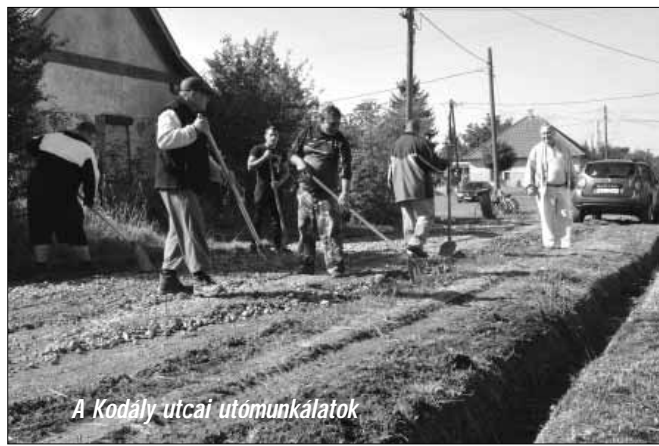
A Kodály utcai utómunkálatok