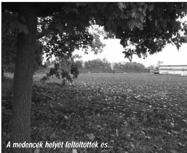
A medencék helyét feltöltötték és...