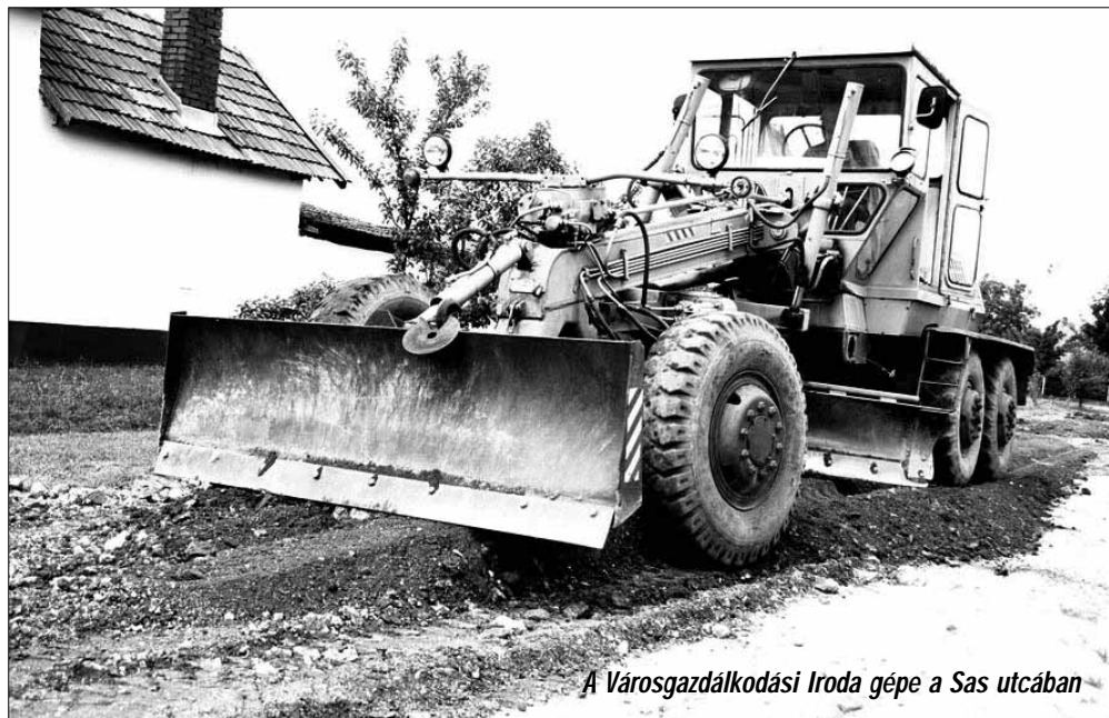
A Városgazdálkodási Iroda gépe a Sas utcában

Nagyon fontos elmondani a program kapcsán, hogy a város valamennyi választókerülete érintett volt az idei útalap rekonstrukciós programban. Az 1-es választókerületben a Lehel, a Szegfű és a Kálvin utcákban, a 2-es választókerületben a Csokónai, a Damjanich, a Dembinszky, a Nagy Sándor utcákban, a 3-as választókerületben a Dózsa, a Március, a Márki Sándor, a Mérleg, a Nyár, a Sas, a Tavasz, a Temesvári, az Orgona utcákban és a Táncsics téren, a 4-