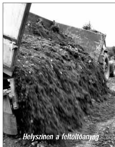
Helyszínen a feltöltőanyag