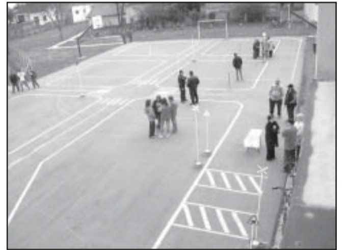
Az új pálya Kötögyánban

Április végén a kötögyáni Általános Iskola udvarán kerékpáros szabályossági pályát avattak egybekötve a Kerékpáros Iskola Kupa (KIK) területi döntőjével. A pálya építését Sarkad Város Balesetmegelőző Bizottsága kezdeményezte és pályázaton nyert összegekből, valamint a sarkadi Aeroferr vállalkozás munkájából sikerült kivitelezni.