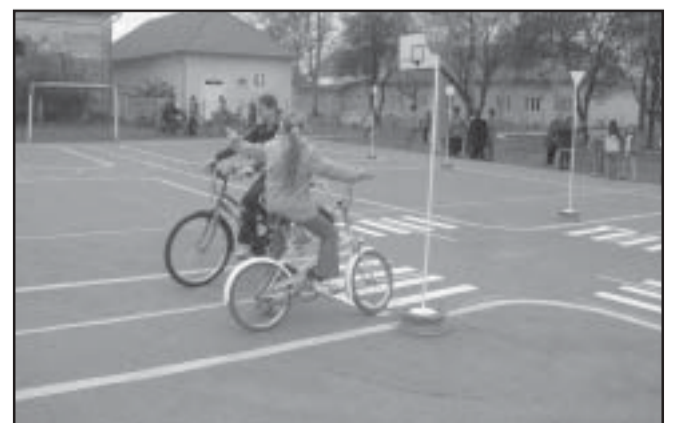
A területi versenyen