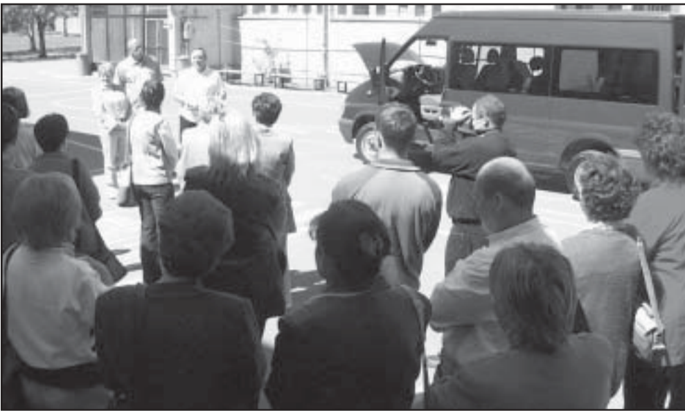
Képeink a Ford Transit birtokba adásáról-vételéről készültek