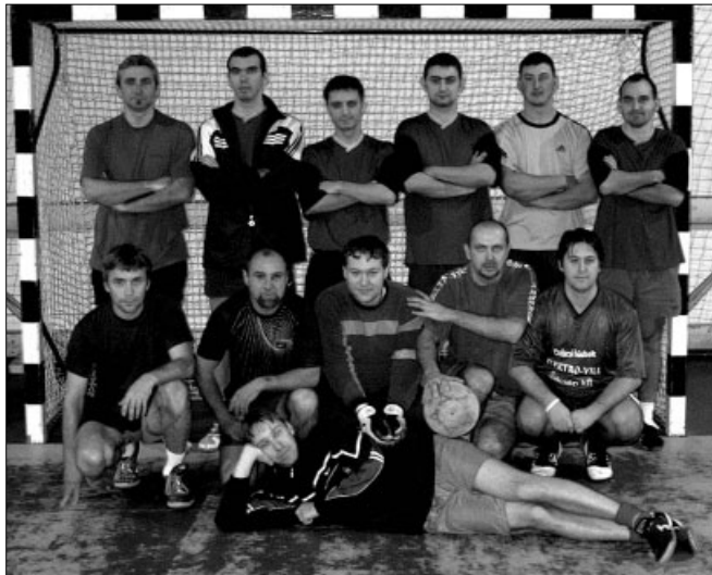
A Mórocz Infó csapata