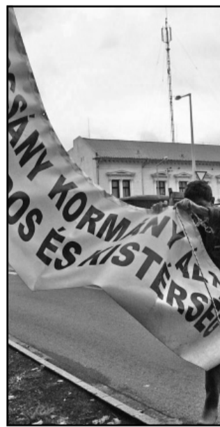
A küzdelem utolsó epizódja: tábla leszerelés

A Sarkad és Környéke Többcélú Kistérségi Társulás elnöke