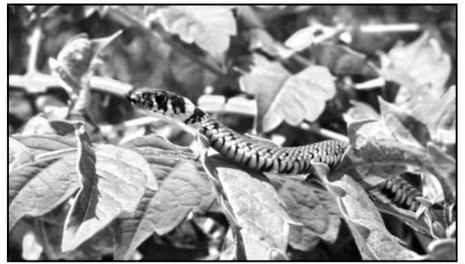
Ezt a kis vízisiklót a kertemben fotóztam, legyekre vadászott

A kígyó borzasztó hosszú állat, hosszabb a legrövidebb öntözőcsőnél is. Előfordul mind az öt földrészén és a patikák címerein.