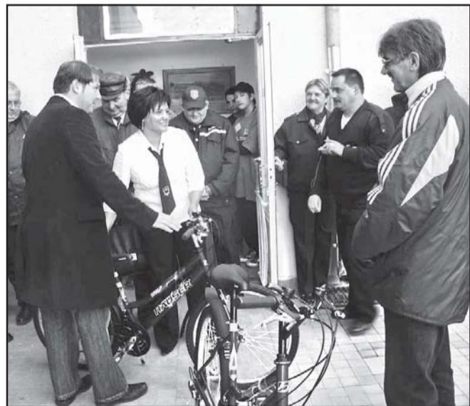
Az ajándék kerékpárokat az iskolák képviselői vették át