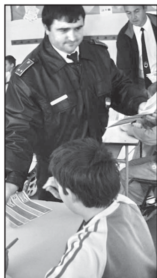
Az asztalon a kerékpáros közlekedés szabályainak a tesztlapja