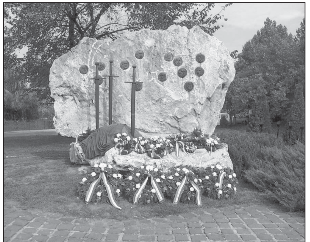
Az Aradi Vértanúk emlékműve a fegyverletelt szimbóizáló földbe szúrt – eredeti – kardokkal