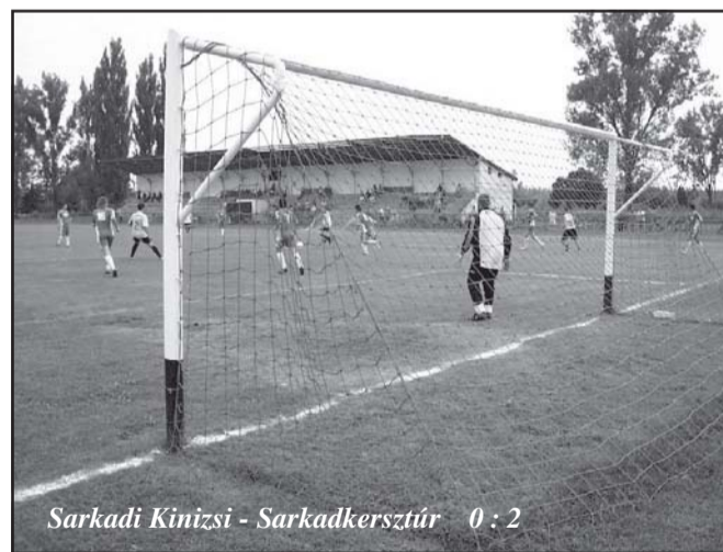
Sarkadi Kinizsi - Sarkadkersztúr 0 : 2

A Sarkadi Kinizsi Labdarúgó Egyesület soron következő előkészületi mérkőzése a következők: