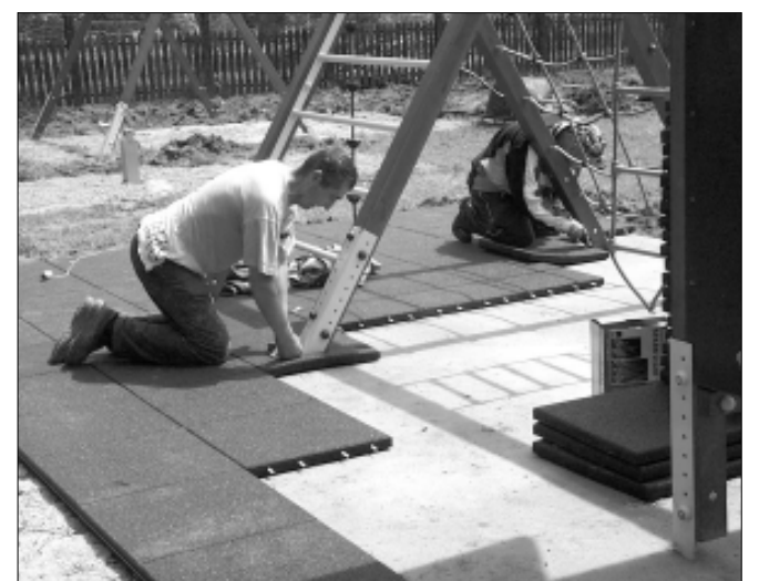
Vastag és rugalmas gumiszőnyeget fektetnek le a mászó torony alatti területre a kivitelező munkatársai