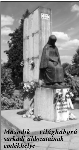
Második világháború sarkadi áldozatainak emlékhelye

Negyvenkilenc név, apák és fiak. Vissza-visszatérő kérdés: miként lehetett a csatamezőkön, számtalanszor, szembenézni a halállal és mindig erősebbnek lenni, mint a halálfélelem? Az egyetlen Magyarországról, az egyetlen Magyarországról.