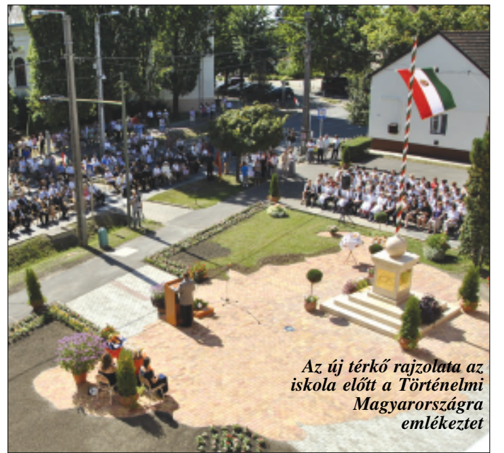
Az új térkő rajzolata az iskola előtt a Történelmi Magyarországra emlékeztet