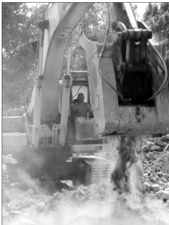
Ezeknek a gépeknek „meg sem kottyannak” a betondarabok

Egyrészt a pályázat megnyerése lehetővé tette Sarkad Város Önkormányzatának, hogy 750.000 Ft. saját tőke mellett, a pályázaton nyert 2.300.000 Ft. segítségével (Folytatás a 2. oldalon)