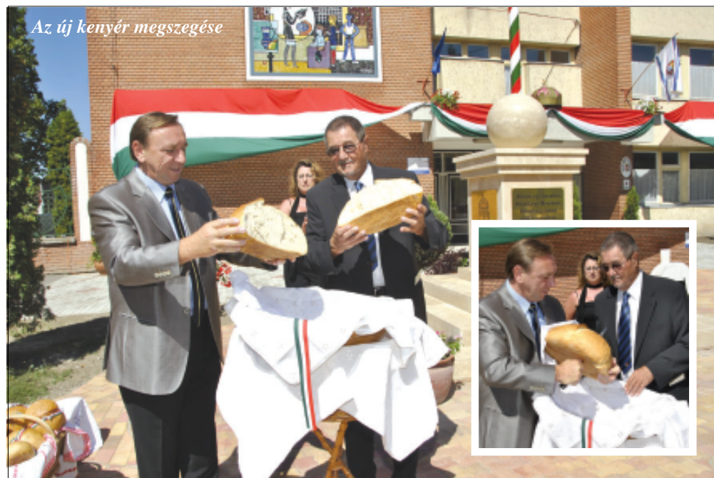
Az új kenyér megszegése