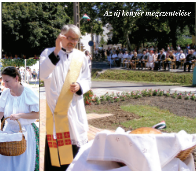
Az új kenyér megszentelése