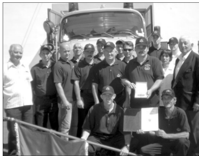
A képviselő-testület Sarkadért kitüntetését adományozott a Városi Tűzoltóegyesület részére.

Kereskedelmi tevékenysége mellett aktív és elkötelezett támogatója a városi intézményeknek és rendezvényeknek. Különösen közel áll szívéhez a sport, s ezen belül is kiemelten a labdarúgás.