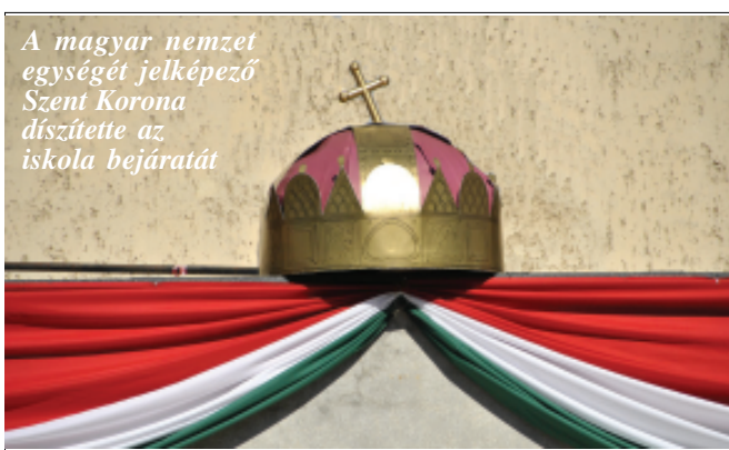
A magyar nemzet egységét jelképező Szent Korona díszítette az iskola bejáratát