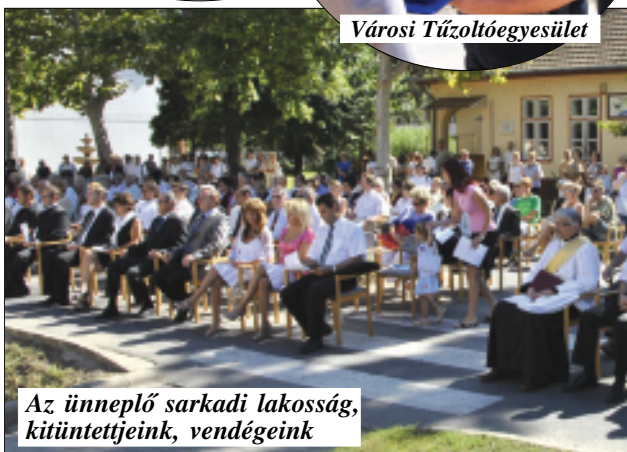
Az ünneplő sarkadi lakosság, kitüntetettjeink, vendégeink