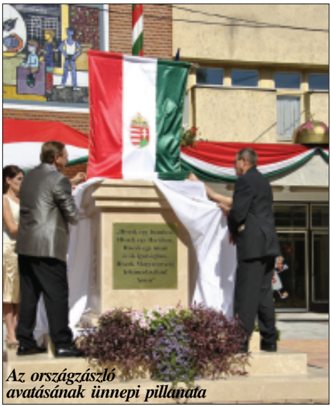
Az országzászló avatásának ünnepi pillanata