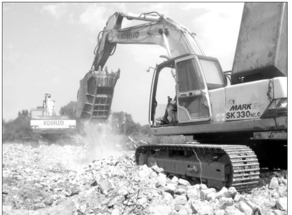
A kőtörő gép munka közben az Anti úton

Aki gyakrabban megfordult az Anti út Ady Endre utca kereszteződésének környékén, annak feltűnhetett, hogy egy „betontemető” éktelenkedik az említett területen, ahová a szétbontott, néhai BÉKÖT maradványai, illetve egyéb betonhulladékok kerültek felhalmozásra. Azonban manapság arra járva már azzal szembesülhetünk, hogy hatalmas kőtörő gépek