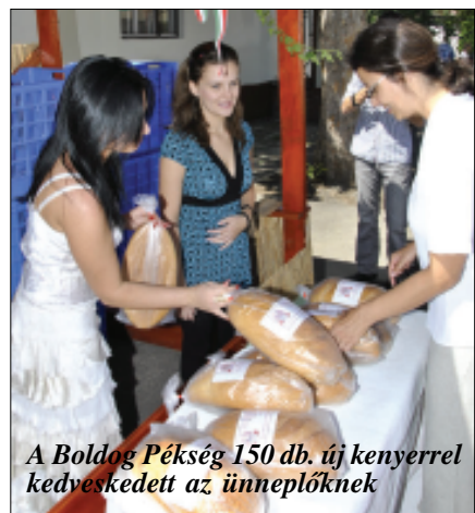
A Boldog Pékség 150 db. új kenyerral kedveskedett az ünneplőknek