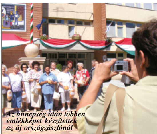
Az ünnepség után többen emlékképet készítettek az új országzászlónál