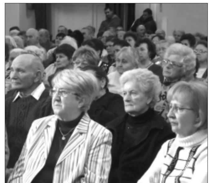
Az ünnepeltek egy csoportja