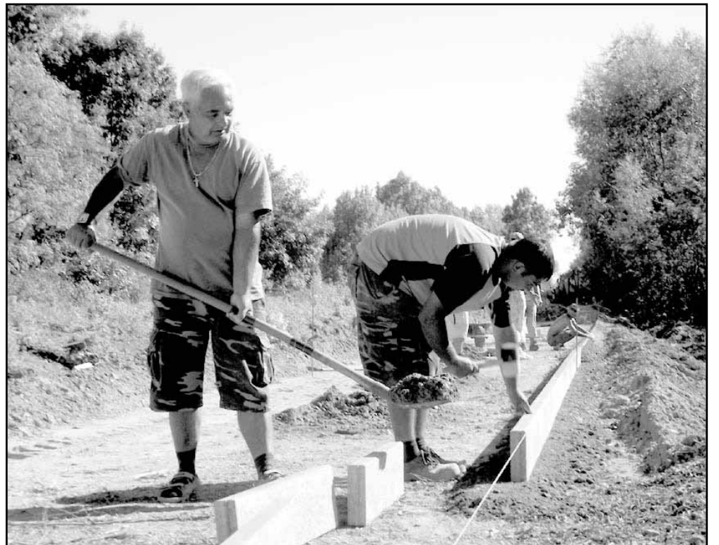
A Sarkadkeresztúr irányába vezető kerékpárút elkészültét követően elkezdődik a Nagyszalonta felé vezető kerékpárút építése is