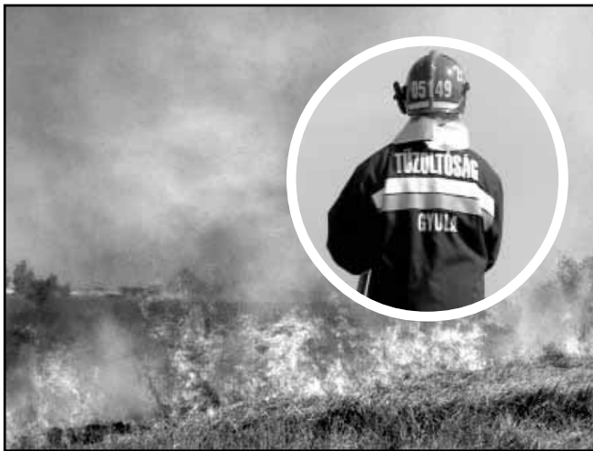
Augusztus 22-én a tilalom elrendelésének napján nagy erővel keltt kivonulniuk a tűzoltóknak Sarkad és Méhkerék közötti területre, mintegy 300 ha legelő kapott lángra. Az oltásban részt vettek a sarkadi önkéntes tűzoltók is.

A kiszáradt árokparton, a vasúti töltések mellett keletkező tüzek sok esetben közvetlenül erdő- és mezőgazdasági területeket is veszélyeztetnek. A közlemény figyelmeztet, hogy aki a tűzvédelmi rendelkezéseket megszegi, erdővédelmi bírsággal sújtható.