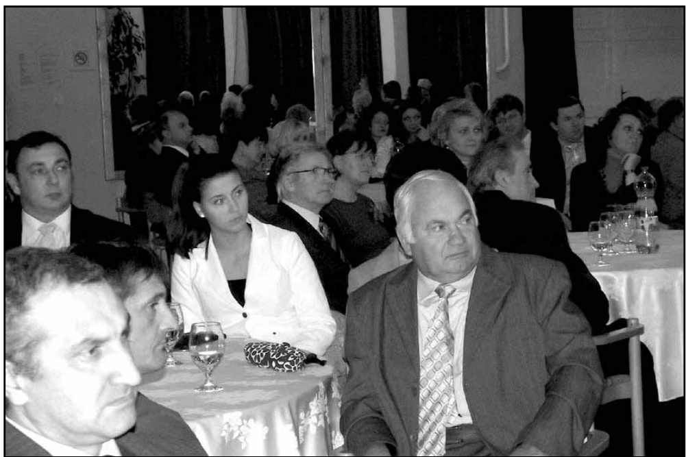
Az önkormányzati partnerek és a helyi vállalkozók tiszteletére rendezett estélyre a meghívottak túlnyomó része elfogadta a meghívást