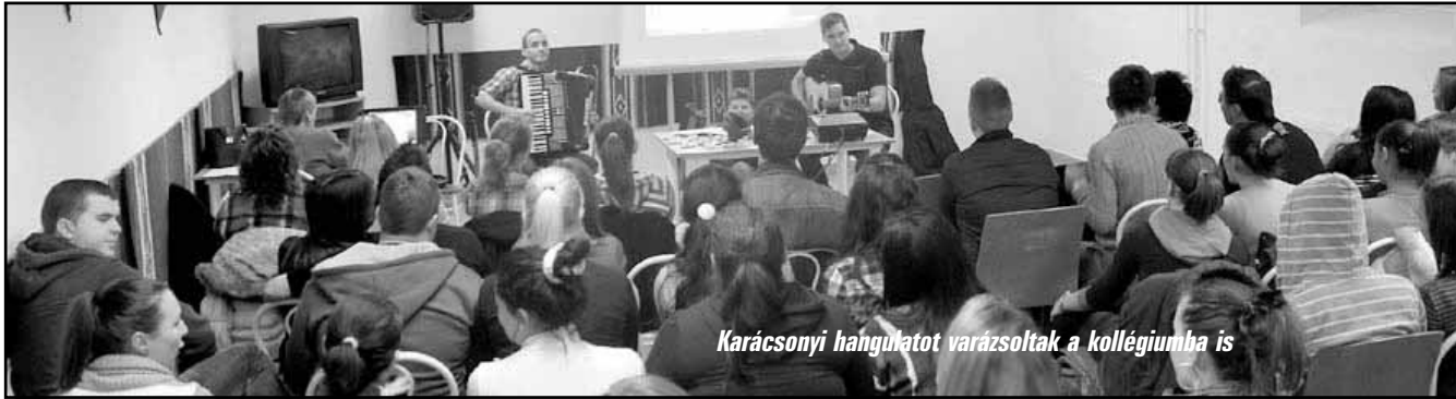
Karácsonyi hangulatot varázoltak a kollégiumba is