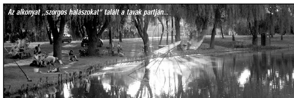
Az alkonyat „szorgos halászkokat” talált a tavak partján...