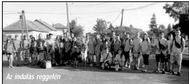
Az indulás reggelén

Isten legszebb tája, világ édes bája. Emelem kalapom, előtted, Balaton (Kasza Béla - Magyar Tenger)