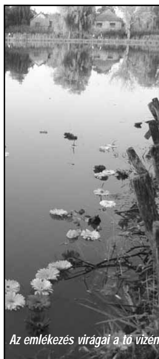
Az emlékezés virágai a tó vizén