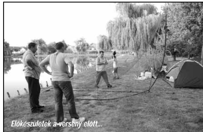
Előkészületek a verseny előtt...