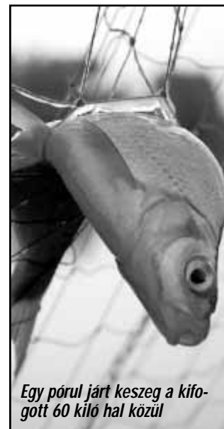
Egy pórul járt keszeg a kifogott 60 kiló hal közül