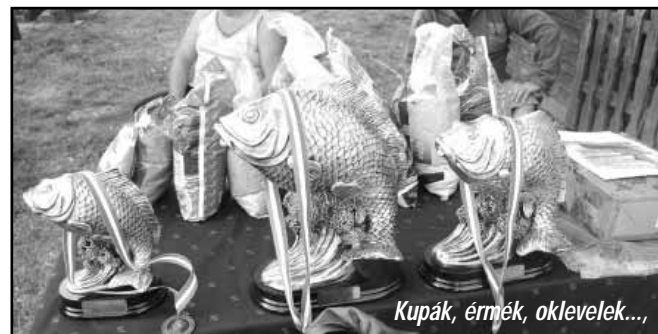
Kupák, érmék, oklevelek...