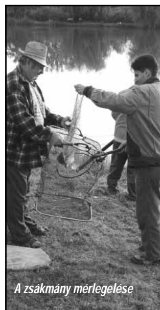
A zsákmány mérlegelése